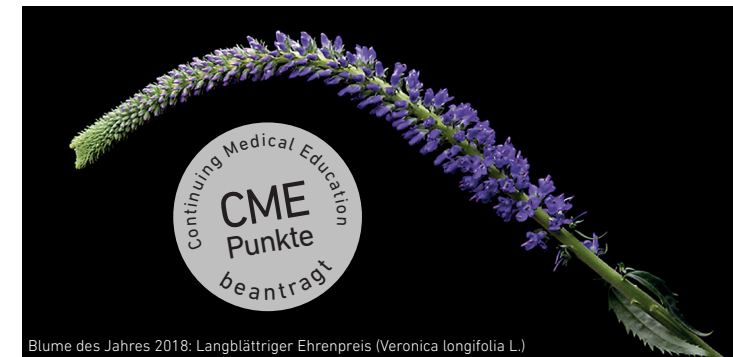
Blume des Jahres 2018: Langblättriger Ehrenpreis (Veronica longifolia L.)

Samstag, 21. April 2018, 09.30 – 14.30 Uhr im LADR Zentrallabor Dr. Kramer & Kollegen in Geesthacht