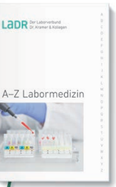
Unser Leistungsverzeichnis A-Z Labormedizin als Buch

Einen Überblick über das gesamte labormedizinische Analysespektrum des LADR Laborverbundes erhalten Sie mit unserem Leistungsverzeichnis A-Z Labormedizin . Ein unentbehrlicher Ratgeber, den Sie als Einsender kostenlos bestellen können: 0800 0850-113 . Wenn Sie online im Verzeichnis nachschlagen möchten: www.LADR.de/diagnostik/a-z-suche