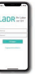
Mit der LADR Labor App sind alle Laborresultate online abrufbar. Hier geht es zum Download: www.LADR.de/LADR-app