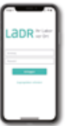
Mit der LADR Labor App sind alle Laborresultate online abrufbar. Hier geht es zum Download: www.LADR.de/LADR-app

Als Einsender*in können Sie jederzeit und überall auf die Laborresultate zugreifen: mit der LADR Labor App für iOS und Android sowie im Browser auf Ihrem Computer. Die Einzelwerte sind unmittelbar nach der Validation online abrufbar. Auf Wunsch informiert Sie eine integrierte Alarmfunktion, wenn schnelles Handeln gefragt ist, zum Beispiel bei Extremwerten.