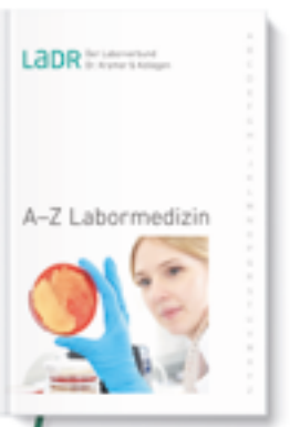
Unser Leistungsverzeichnis A-Z Labormedizin als Buch

Einen Überblick über das gesamte labormedizinische Analysespektrum des LADR Laborverbundes erhalten Sie mit unserem Leistungsverzeichnis A-Z Labormedizin . Ein unentbehrlicher Ratgeber, den Sie als Einsender kostenlos bestellen können: 0800 0850-113 . Wenn Sie online im Verzeichnis nachschlagen möchten: www.LADR.de/diagnostik/a-z-suche