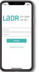
Mit der LADR Labor App sind alle Laborresultate online abrufbar. Hier geht es zum Download: www.LADR.de/LADR-app