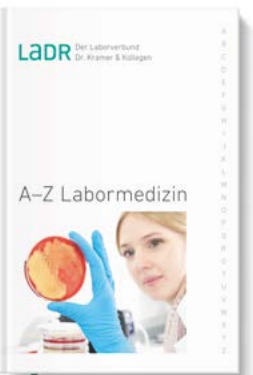
Unser Leistungsverzeichnis A-Z Labormedizin als Buch

Einen Überblick über das gesamte labormedizinische Analysespektrum des LADR Laborverbundes erhalten Sie mit unserem Leistungsverzeichnis A-Z Labormedizin . Ein unentbehrlicher Ratgeber, den Sie als Einsender kostenlos bestellen können: 0800 0850-113 . Wenn Sie online im Verzeichnis nachschlagen möchten: www.LADR.de/diagnostik/a-z-suche