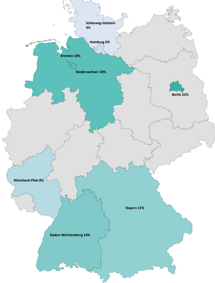
6. bundesweite Verteilung positiver Befunde von synthetischen Cannabinoiden